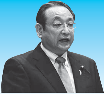
原 克美 議員