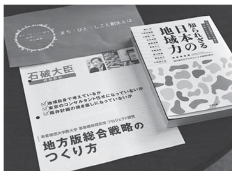
地方版総合戦略資料

町長 ①島根県のスケジュールでは、6月戦略骨子の提示、8月には素案提示、9定例議会での戦略承認を経て、次年度予算への反映を予定されている。美郷町も県の流れに歩調を合わせ作成にあたる。