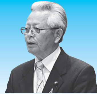
岩根 和博 議員