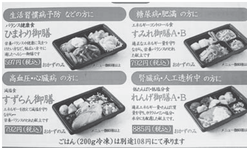
病態食の宅配メニュー