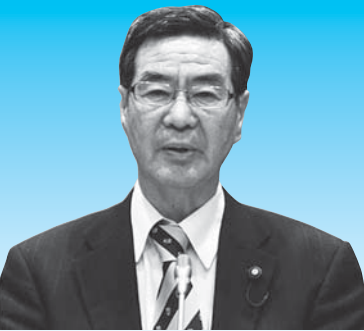
黒川 民次郎 議員