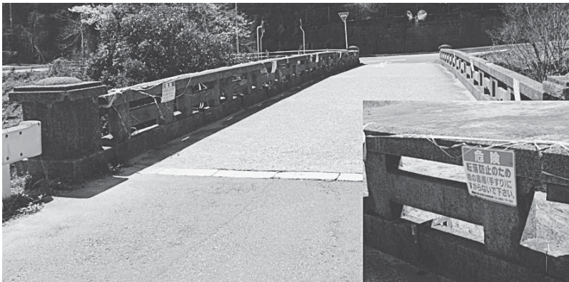
対策が進まない宝来橋