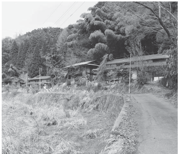
無人となった集落

は150万円を支援しているが、5年たつて問題が解決できないものではなく、5年10年と支援を続ける必要があると認識している。