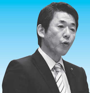
藤原 修治 議員