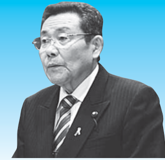
旗根 正一 議員